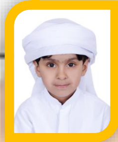
السفير الرقمي علي مطر المزروعى