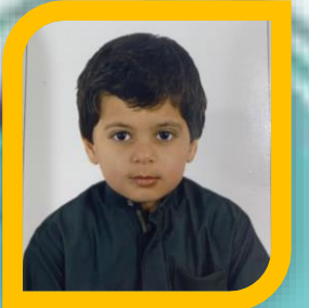
السفير الرقمي عامر جاسم الكري