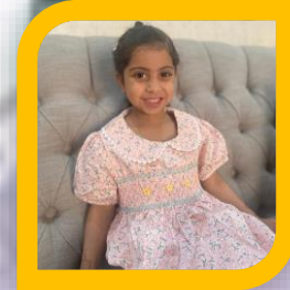
السفيرة الرقمية ريم مطر المزروعى