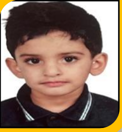
السفير الرقمي سيف سعيد المزروعى