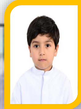
السفير الرقمي سيف أحمد المزروعى