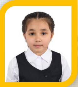
السفيرة الرقمية حمده سالم