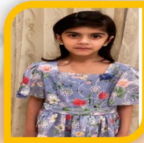
السفيرة الرقمية شيخة إبراهيم الحمادي