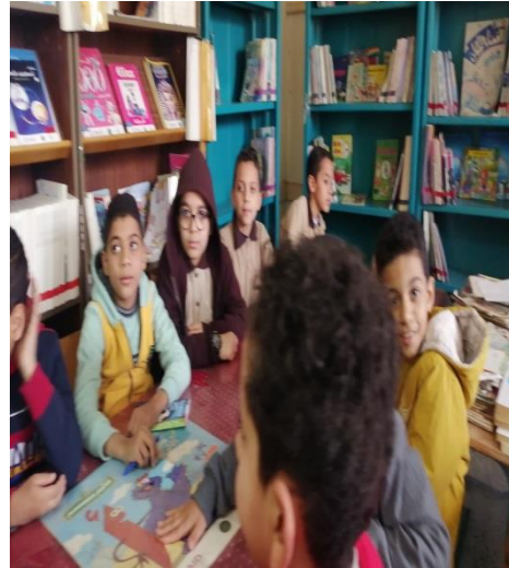
ش . ط