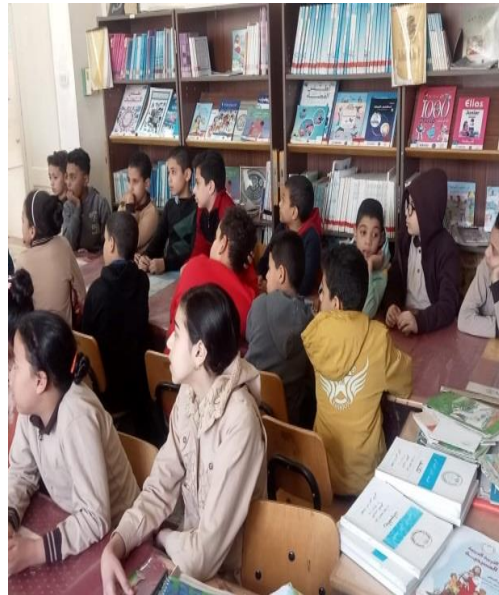
ش . ط