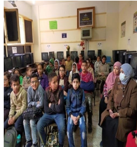
ش . ط