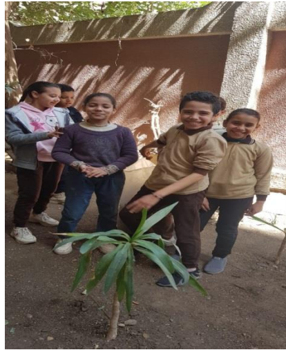
ش . ط