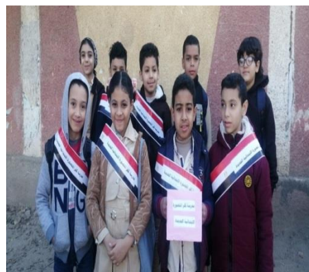
ش . ط