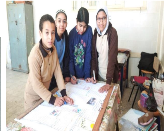
ش . ط