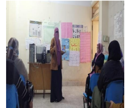
ش . ط