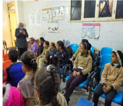
ش . ط