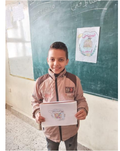
ش . ط