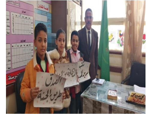
ش . ط