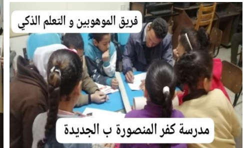
ش . ط