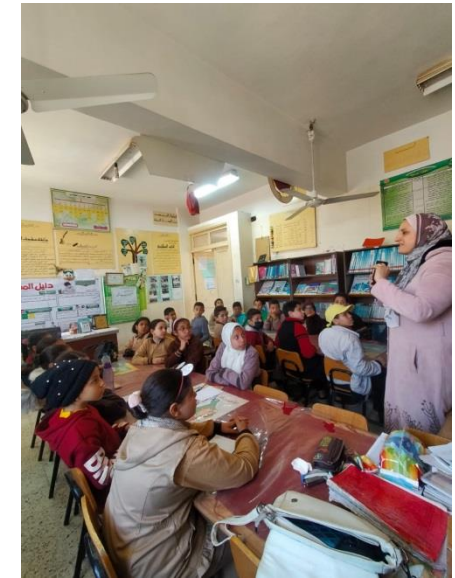
ش . ط