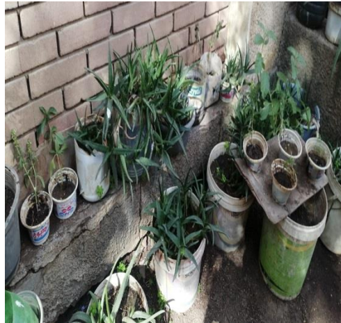
ش . ط