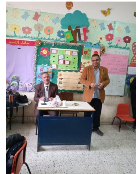
ش . ط