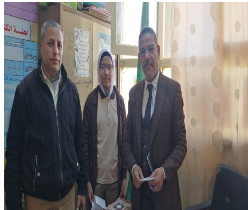
ش . ط