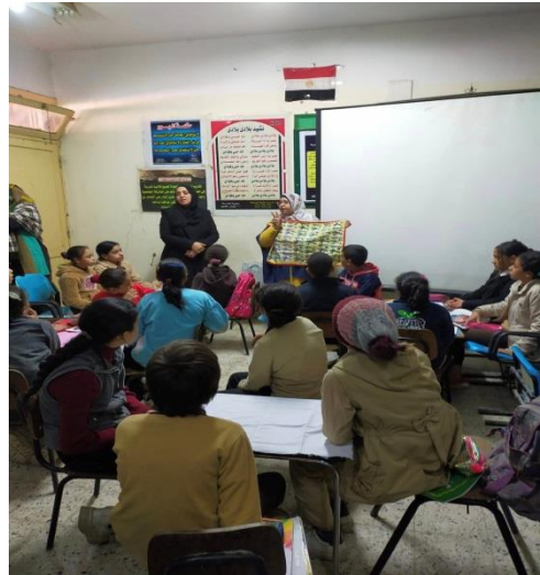
ش . ط