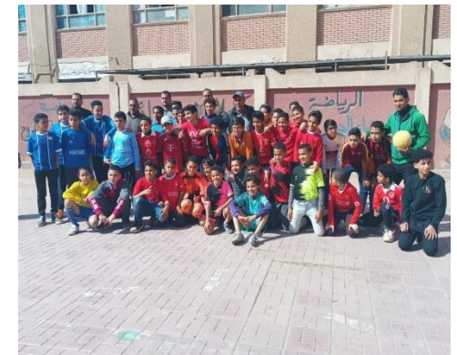
ش . ط