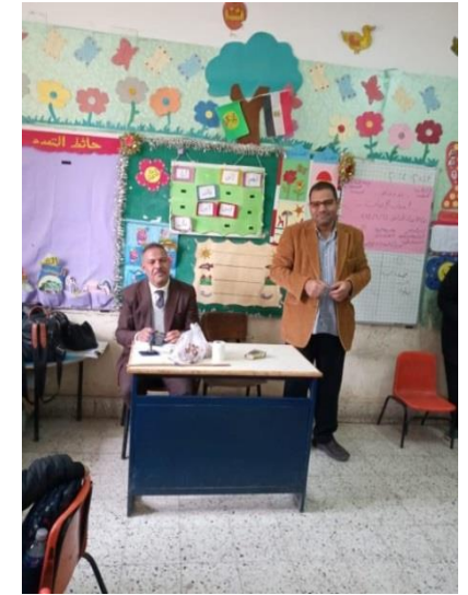
ش . ط