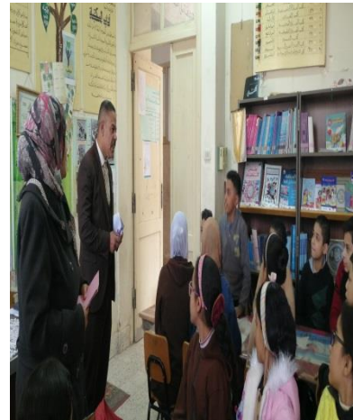
ش . ط