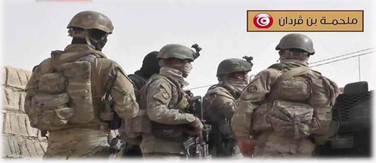
ملحمة بن قردان