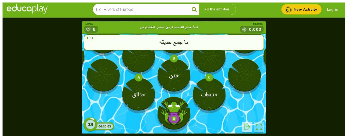
لعبة جمع الكلمات فريق التميز التكنولوجي