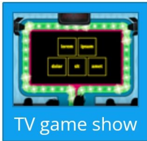
TV game show