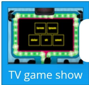
TV game show