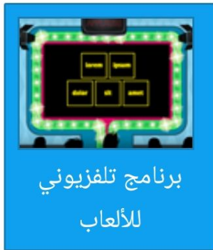
برنامج تلفزيوني للألعاب