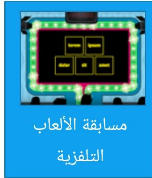
مسابقة الألعاب التلفزية